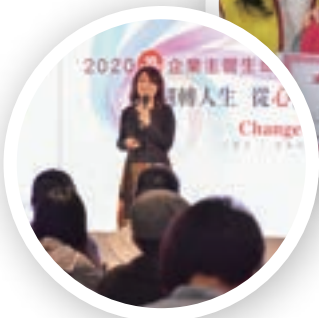
企業主管 生命成長營