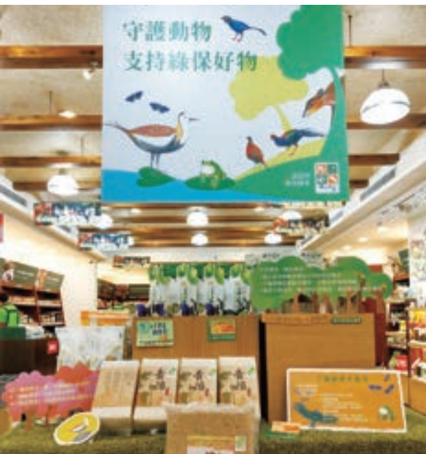
消費者因為支持里仁，共同投入了愛護環境的志業。

實際上卻充滿各種限制，消費者必須不斷地自行登錄。一銀的優惠資訊則是登記一次就能使用一整年。