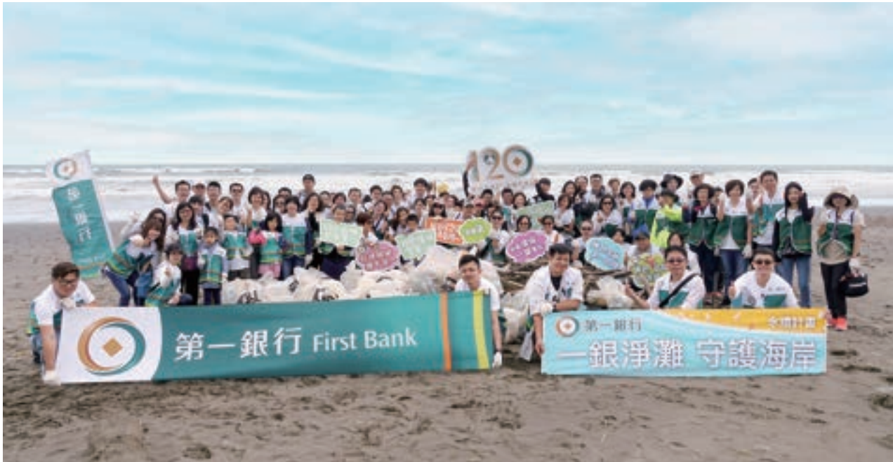
第一銀行多年來積極推動綠色投資、綠色消費及環保公益等各項活動，並期許成為「綠色金融，第一品牌」。

念，到門市人員的推廣說法，都不鼓勵過度消費，而是強調讓日常的消費展現公益價值。消費者手上動輒數張信用卡，願意申辦一張有公益理念的卡，自然不是錦上添花，而是個人善意驅動或環保意識下的行動。