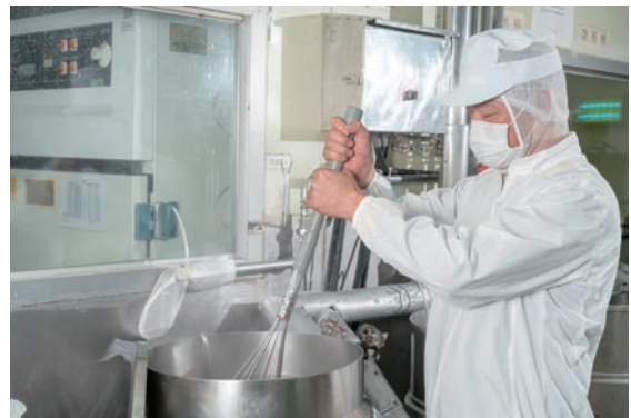
(右) 維持吸凍的口感又不失自然，來自研發人員鑽而不捨地挑戰。