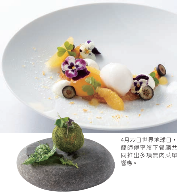
4月22日世界地球日，簡師傅率旗下餐廳共同推出多項無肉菜單響應。

為果泥，搭配高雄內門的荔枝蜂蜜，做成天然無添加的玉荷包吐司，深受饕客歡迎，成為其餐飲集團旗下的明星商品。