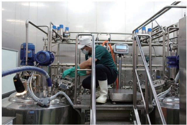
(左) 黑豆的運用很廣泛，全豆黑豆乳和黑豆天貝皆是里仁架上長銷商品。 (右) 精密設備搭配品質優良的原料，和有志做好食物的人們，造就出能永續共好的產品。

在花蓮光復鄉的馬太鞍溼地，返鄉青農以有機方式栽種由臺南區農業改良場在2017年所育成的新品種臺南11號青仁黑豆，相比於其他台灣本土黑豆品種，不僅籽實較大，異黃酮與總花青素含量亦較高。透過栽種，青農守護了這塊溼地，也保護了生態，使環頸雉、斑鳩等動物也能到此棲息與覓食。然而本土的豆類，即便品質優異，在市場上仍因成本較高而較不受青睞。