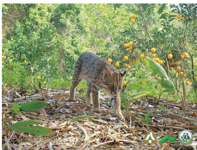
(左) 張源沛悉心照顧的香蕉，在市集擺攤每每受消費者青睞。(右) 南投縣中寮鄉為石虎活動熱區之一，友善耕作讓野生保育跟農業發展是可永續共好。