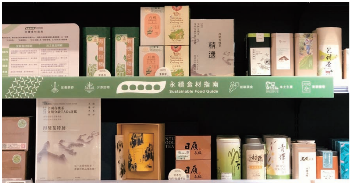
「永續食材指南」可以引導消費者清楚辨識通路架上商品符合哪些永續食材指標。

「低碳蔬食」則是鼓勵低碳的飲食型態，一人三餐不吃肉、蛋、海鮮的蔬食，可以減碳2公斤。越多人實踐永續飲食，就能對生活減碳有實質的效益。「本土生產」關係著食物碳里程，從產地到餐桌的距離越近，運輸過程中產生的溫室氣體排放就越少，而推動在地生產，更能提升本土糧食自給率。