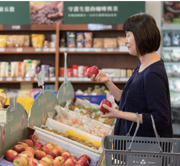
(左) 消費者在選擇每日飲食和食材購買上，就能為減碳盡一分心力。 (右) 永續食材指南鼓勵與生態共存、友善耕作及強調本土的農業生產方式。