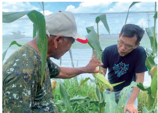
簡師傅勤跑產地，逐步構建食材地圖，如今旗下餐廳使用食材有70%來自本土。

近兩年在疫情與戰爭背景下，國家糧食自給率與環境變遷等議題受到重視，無肉菜單於此時推出，猶如一個適時的倡議。「像是我們餐飲事業群所製作的食材也響應了永續食材指南的申請。有助於環境與生態的事，我都願意參與。」他堅定地表示，開一間餐廳，本來就該做對地球友善的事情。