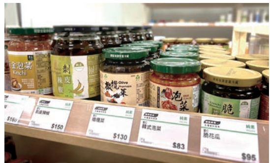
透過「永續食材指南」的豆莢標示，消費者可以檢視商品符合的永續指標。

實踐永續飲食，先從選購永續食材開始。當農友和食品廠在食物背後的努力和價值可以透過「永續食材指南」顯現出來，那麼消費者就可以在每一次的採買中落實永續行動，鼓勵整個食物供應鏈朝永續的方向邁進。